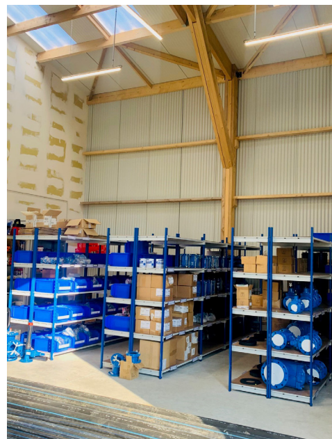
Nouveau bâtiment - Magasin nouveau site d'exploitation