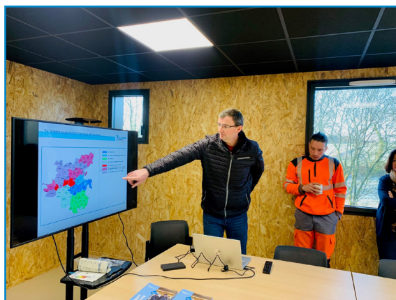
Présentation par les équipes d'Eau du Bassin Rennais